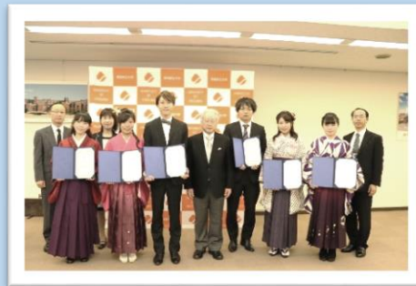
平成29年度コミュニティーフェロー特別表彰