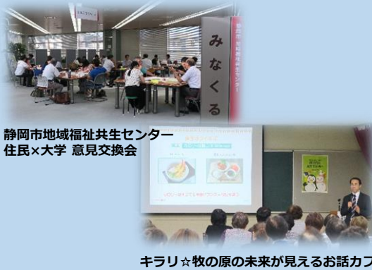
静岡市地域福祉共生センター 住民×大学 意見交換会

主な著書 『トルコ 世紀のはざままで』（NHK出版）、『こう変わる学校 こう変わる大学』（講談社）、『来し方の記 ひとすじの道を歩んで五十年』（かまくら春秋社）他。